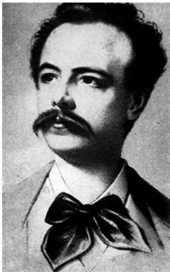
Чарльз Фридерик Ворт